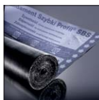
Быстрый Профиль* СБС специальная битумная мембрана Fundament Быстрый Профиль* СБС