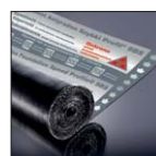
Быстрый Профиль* СБС специальная битумная мембрана Fundament Antyradon Быстрый Профиль* СБС