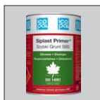
Быстрый Грунт СБС грунтующее средство СБС SIPLAST PRIMER* Быстрый Грунт СБС