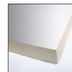
TERMO PIR Термоизоляция – стена фундамента – двухслойная стена – пол

* Предполагаемый период эксплуатации материала, равный сроку службы здания , означает, что материал, встроенный в здание в соответствии с 1) PN-EN 13969: 2006 и 2) назначением и областью применения на основании Технической информации о материале, с которой можно ознакомиться на сайте www.icopal.pl (для осуществления гидроизоляции в конструкциях стен на или под полами или плитами, установленных в грунте для защиты от воды, оказывающей гидростатическое давление, переходящее с грунта внутрь или с одной части конструкции на другую), сохранит свои гидроизоляционные свойства на протяжении всего периода эксплуатации здания в соответствии с его назначением.