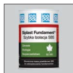
Быстрая Изоляция СБС Специальное гидроизоляционное покрытие СБС SIPLAST FUNDAMENT* Быстрая Изоляция СБС